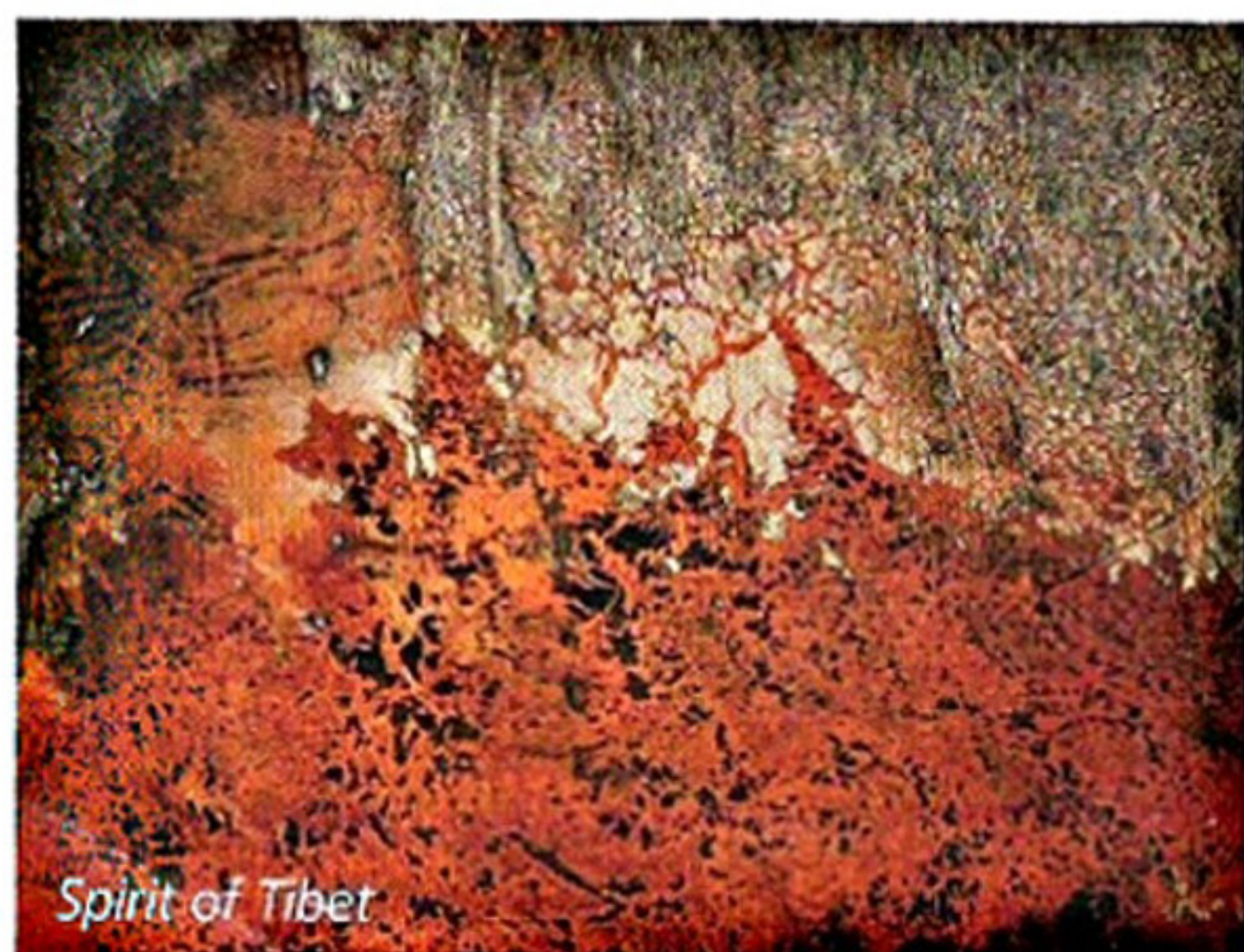
Spirit of Tibet

Wenn es dann sozusagen zur Sache geht, wird als erstes das Format festgelegt, die Rahmenleis-